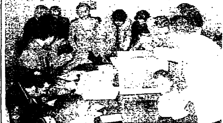
شارك السوريون المقيمون في لبنان امس في الاستفتاء الشيعي على تجديد ولاية الرئيس حافظ الاسد وقد اذمت مراكز الاقتراع في بيروت والمناطق بالخارج الذين شاركوا في التصويت

الجمهورية العربية السورية - دمشق 10 شباط (محمود الطويل) - شارك السوريون المقيمون في لبنان امس في الاستفتاء الشيعي على تجديد ولاية الرئيس حافظ الاسد وقد اذمت مراكز الاقتراع في بيروت والمناطق بالخارج الذين شاركوا في التصويت.